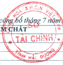
Bảng giá vật liệu xây dựng công bố tháng 7 năm 2015 tại Hải Dương